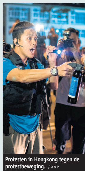
Protesten in Hongkong tegen de protestbeweging.

In Hongkong is een tegenbeweging opgestaan die de wekenlange studentenprotesten in de stad zat is. Meer dan duizend anti-Occupy-demonstranten gingen zaterdag de straat op en riepen leuzen als „Geef Hongkong terug.“ Deze voorstanders van de regering eisen dat de studenten stoppen met het blokkeren van het dagelijks leven in de stad. Hoewel de beide groepen demonstranten niet slaags met elkaar raakten, reageerde een deel van de tegenbeweging zijn woede af op journalisten. ANP